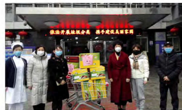
荣华慈善基金会、荣华控股向战斗在一线的医疗机构送去爱心箱