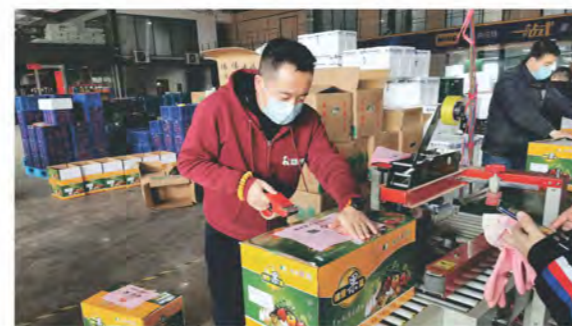
荣华农业党总支战斗在一线，保障市民“菜篮子”

荣鑫物业党总支在各在管小区搭建防疫检查站共30余个，每个检查站成立党员先锋队1支、党员示范岗2名，为打赢战“疫”树立信心；号召各支部共30名党员同志投身一线落实防控措施；积极配合上级部门进行防疫排查和安抚工作，及时上报，让政府放心；持续更新疫情防控宣传工作，引导业主不造谣、不信谣、不传谣、重科学、听官宣。