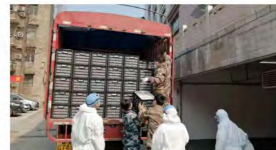
物资抵达中国人民解放军中部战区总医院

2月4日，荣华农业全体员工充分体现社会担当，全力为疫区医院准备蔬果，经过11个小时的车程，25000斤荣华黄陵翡翠梨成功抵达中国人民解放军中部战区总医院新冠肺炎防控指挥部，这批新鲜水果将给予湖北防疫工作的医疗人员和部队官兵的营养搭配。