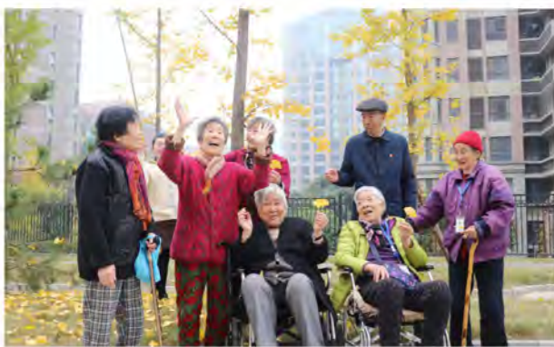
荣爸荣妈的幸福晚年生活