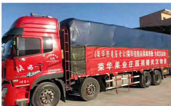
荣华慈善基金会、荣华控股向武汉捐赠物资，助力打赢疫情防控战