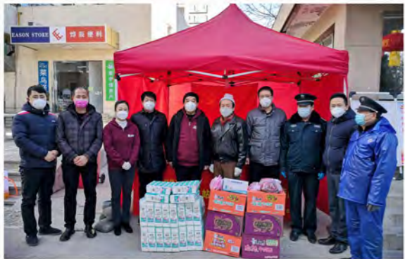
荣华控股疫情防控指挥部为物业一线工作人员送去慰问物资

作为一个负责任、敢担当的企业，抗击疫情，荣华责无旁贷。在这至关重要的时期，在荣华党委的统一领导下，荣华控股全体党员干部、党员同志以坚定的信念和行动，彰显“疫情就是命令，防控就是责任”的政治自觉，始终保持“一个党员就是一面旗帜，一个支部就是一个堡垒”的初心，发扬着源自骨子里的主动与担当，时时刻刻与党连心，与百姓贴心，让政府放心！