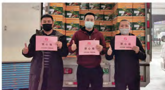
党员干部为支援武汉准备物资

1月29日晚，集团党委班子成员、党员志愿者们连夜组织打包“荣华爱心箱”和营养用品，于1月30日加急送往全市近百个社区和养老机构，为奋战在各防疫一线的工作人员以及老人们送去爱心和温暖。