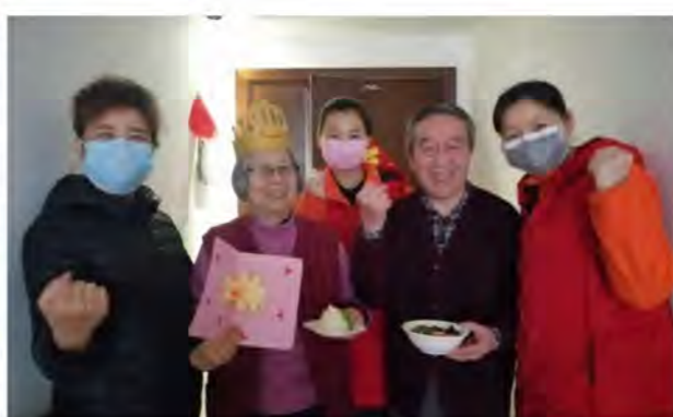
祝福小分队为荣爸荣妈庆祝生日

在荣华·清荷园，为荣爸荣妈共同庆祝的生日宴会一直是独特的风景线。考虑到疫情要求，荣爸荣妈的“子女”们依然精心安排、用心祝福，为长者办了一场特殊的生日会。