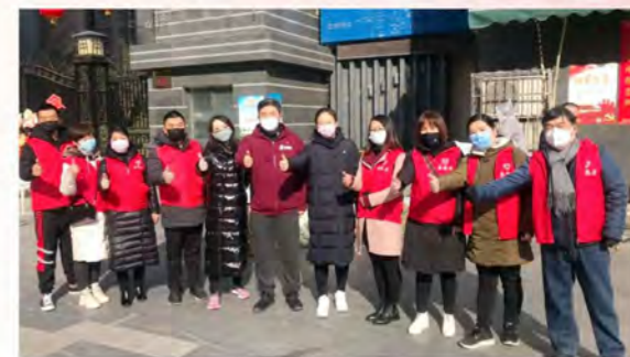
荣华党员社区配送服务队

2月2日起，曲江荣华党支部组织党员成立共30人的“曲江荣华党员志愿队”，参与净菜搬运志愿活动和“曲江新区蔬菜进社区”定点售卖志愿活动。