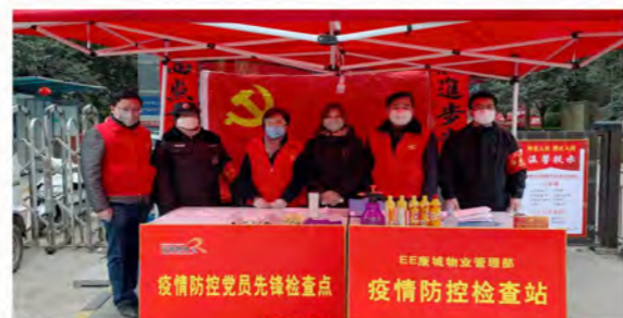
荣鑫物业党总支党员先锋检查点、党员示范岗

荣华养老党总支号召全体员工签署《疫情防控承诺书》、发布《致家人们的一封信》，全面落实各项疫情防控措施，对园区采取封闭式管理，构筑群防群治的严密防线。同时加强舆论引导工作，主动为园区长者采购生活必需品，并组织园区内长者开展“武汉加油”手工涂鸦活动，确保园区长者生活无忧、心情愉悦。