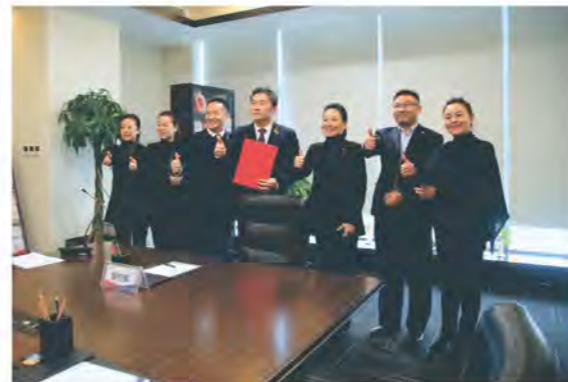
签约方：荣华控股企业集团