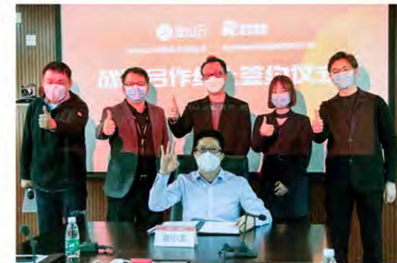
签约方：小米金山云

2月26日，荣华控股与北京金山云网络技术有限公司（简称“金山云”）以视频会议形式完成了云上战略签约。双方将基于各自的主营业务与资源优势，建立密切的战略合作伙伴关系，共同开拓智慧人居生态市场，并在智慧楼宇、智慧社区等方面开展深入合作，打造精品标杆项目。