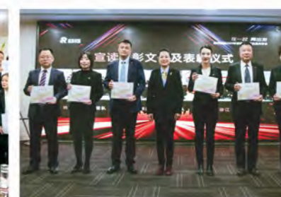
荣华控股优秀团队表彰