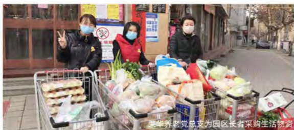
荣华养老党总支为园区长者采购生活物资

荣华养老党总支号召全体员工签署《疫情防控承诺书》、发布《致家人们的一封信》，全面落实各项疫情防控措施，对园区采取封闭式管理，构筑群防群治的严密防线。同时加强舆论引导工作，主动为园区长者采购生活必需品，并组织园区内长者开展“武汉加油”手工涂鸦活动，确保园区长者生活无忧、心情愉悦。