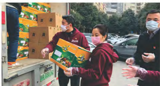
集团领导为一线工作者和老人们送去爱心箱

1月29日晚，集团党委班子成员、党员志愿者们连夜组织打包“荣华爱心箱”和营养用品，于1月30日加急送往全市近百个社区和养老机构，为奋战在各防疫一线的工作人员以及老人们送去爱心和温暖。