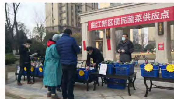
曲江荣华党员志愿队

2月2日起，曲江荣华党支部组织党员成立共30人的“曲江荣华党员志愿队”，参与净菜搬运志愿活动和“曲江新区蔬菜进社区”定点售卖志愿活动。