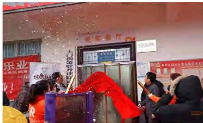
“老年餐厅”揭牌仪式