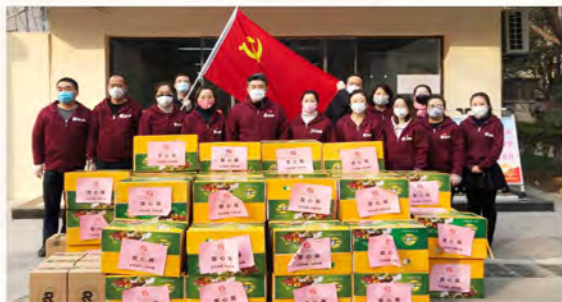
荣华慈善基金会、荣华控股组织志愿者队伍将爱心箱送往全市多个社区