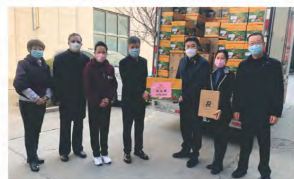
党委班子成员率先做表率，投身一线送物资助力战“疫”