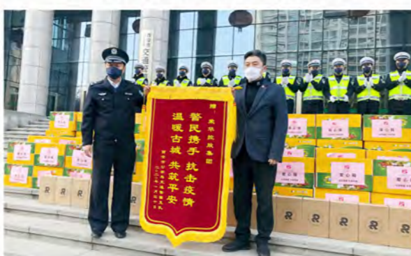
荣华慈善基金会、荣华控股向战斗在一线的公安干警送去爱心箱