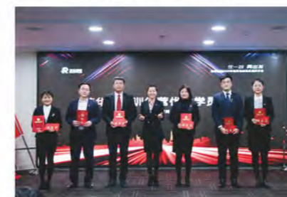
荣华力量训练营优秀学员表彰