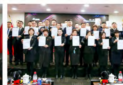
各板块签订2020年度经营目标责任书