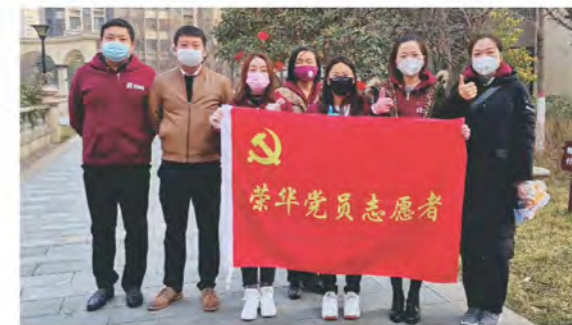
荣华党员社区防控志愿队

2月12日起，荣华控股党委将社区工作更加精细化部署，号召党员同志43人，组成“荣华党员社区防控志愿队”，坚守在社区防控工作第一线。