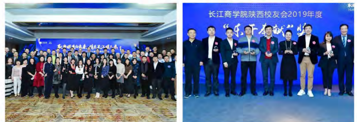
长江商学院陕西校友会企业家论坛暨迎新年会