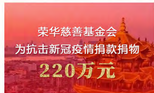
荣华慈善基金会为抗击疫情捐款捐物220万

三月，春分已至，暖意盎然、大地复苏。我们坚信，风能够吹熄蜡烛，却能让篝火越烧越旺。在智慧社区部署社区智能化设备和云端智慧方案，打造“新人居环境”，在美丽的鄂邑区，打造集康养、教育、旅游、生态为一体的荣华数字康养文旅小镇……在荣华，第三次新创业的序篇，没有因为一场疫情而休止。向着春天、迎着希望、朝着梦想，荣华人须臾未曾停歇，期待并坚信春华秋实、硕果盈枝！